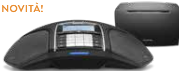
KONFTEL 300Wx IP

L'unione di Konftel 300Wx con Konftel IP DECT 10 costituisce una delle soluzioni più comuni. Adesso è disponibile come pacchetto singolo che offre chiamate in conferenza in qualità HD tramite il proprio sistema di telefonia IP (SIP). Ogni base IP DECT può gestire fino a 20 dispositivi Konftel 300Wx registrati e cinque chiamate in ingresso.