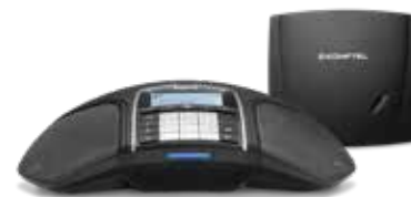
KONFTEL 300Wx ANALOGICO

Semplice e affidabile. Konftel 300Wx con Konftel DECT Base per collegamento analogico. Basta collegare la stazione base alla presa del telefono e la soluzione per conferenze senza fili è pronta, con fino a sette telefoni collegati.